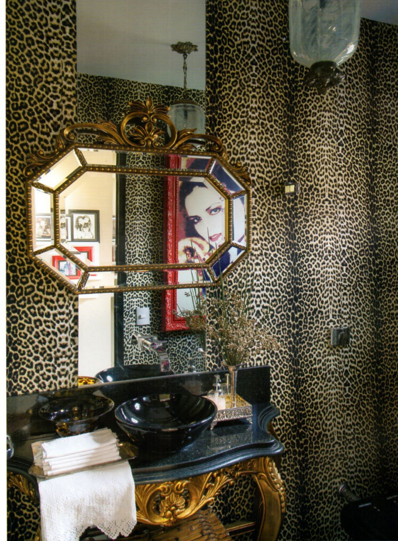
O lavabo tem as paredes revestidas com tecido animal print e possui louças pretas com desenho moderno, aliadas a peças de antiquário como a bancada de madeira folheada a ouro, o espelho e a luminária de opalina.